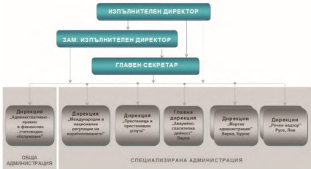
Фигура 1 Структура на ИАМА