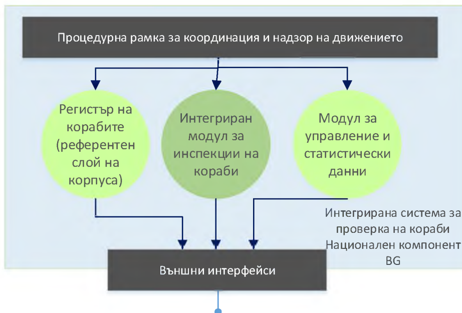
Фигура 4 Функционални модули на ИИС за инспекции на кораби, компонент за България

Структурата на функционалния модел на Интегрираната система за инспекции на кораби, която трябва да бъде доставена е показана на фигурата по-долу: